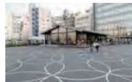
千代田区四番町 5-9 (日本テレビ通り沿い) http://areaworks.jp/service/area/bancho/bancho_niwa

イベントも頻繁に開催され、子どもたちは元気に遊び、大人ものんびりひと休みできる癒やしの広場。番町、麹町の住民たちはもちろん、学校や職場などで、このエリアに通う人たちがいつもにぎわっています。