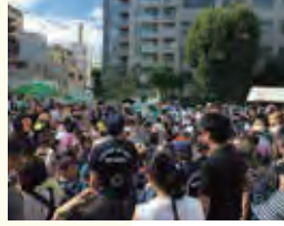
毎年恒例の番町子供会との共同夏休みイベントは大盛り上がり

「子どものころは街に空き地が多く、秘密基地をつくりたり、地面の石をひっくり返して虫