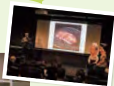
日本におけるスペイン料理の第一人者、ジョゼップ・バラオナ氏によるトークショー