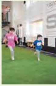
侑真くんと颯太くんは普段は別々でトレーニング。今日は兄弟一緒のため、日ごころの成果を披露しつつ、競いあっています