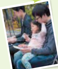
おとうさんが審査中。笑いは厳しめ