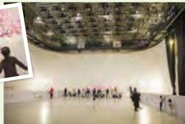
白い壁はお絵描き放題! 思う存分お絵描きできます