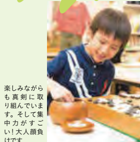
楽しみながらも真剣に取り組んでいます。そして集中力がすごい!大人顔負けです