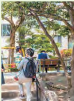
公園に足を踏み入れたとたん、走りっぱなし。もう止めるには抱き上げるしかありません