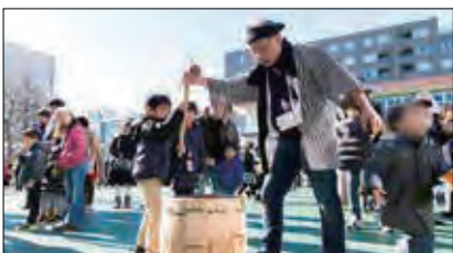
番町連合 獅子舞・餅つき大会

毎年行なわれている番町の新年の風物詩。 2018年は1月13日土曜に番町小学校校庭で 開催された。鏡開きや番町小学校の生徒さんによる和太鼓演奏、獅子舞、豚汁と甘酒の振る舞いなどさまざまな催しで来場者を楽しませた。