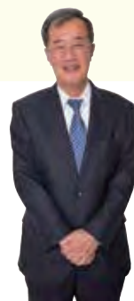
1961年卒業。麹町中学校、早稲田大学高等学院から早稲田大学へ。小学生のときから現在まで番町に在住。

諸さんは小学校2年生のときに、秩父市から一家で番町に移り住みました。「家はもともと製材業でした。戦後は復興や特需で景気がよかったです。昭和30年ごろから材木の輸入が自由化されました。国産は値段で太刀打ちできなくなり、東京で新しく商売を始めようと出てきたんです。」