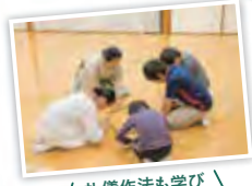
礼儀作法も学び のうちです