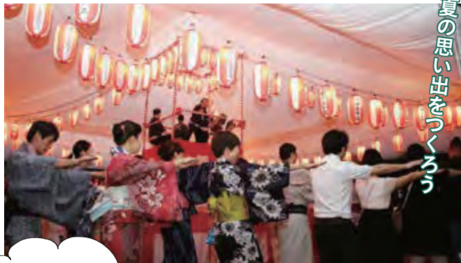
夏の思い出をきりこぼそう

されます。日枝神社の盆踊りは6月という早い時期の開催とあり、シーズンの幕開けを心待ちにしていた人々で大にぎわい! 生太鼓の音が会場を盛りあげます。期間中は屋台も出るので、ひと足早く夏祭りを楽しみましょう。