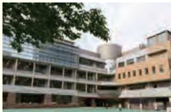
幼稚園児専用のスペース。校庭も小学生と時間を分けて使用

番町小学校と並び、東京を代表する名門公立小学校として知られています。前身となる学校の開校は明治時代。2校が統合し、新たな麹町小学校となったのは平成5年のこと。今年で25周年となります。施設も新しく、恵まれた快適な環境です。麹町幼稚園も同じ建物内にあり、園長先生と校長先生は兼任。幼稚園時代から同じ学び舎で8年、9年を過ごす子もおり、アットホームな雰囲気です。違う学年同士でのランチルーム給食や、1～6年生、縦割りグループのキッズ班で出かける全校遠足なども開催。全校児童504人が仲よく元気に過ごしています。