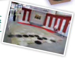
JR市ヶ谷駅構内には モザイクアートが!