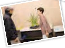
「間」をどう活かすの かがポイント