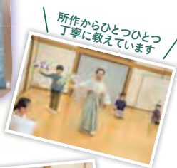
所作からひとつひとつ 丁寧に教えています