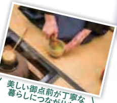
美しい御点前が丁寧な 暮らしにつながります