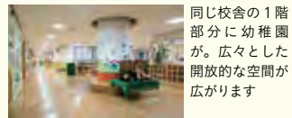
同じ校舎の1階部分に幼稚園が。広々とした開放的な空間が広がります

今号からリレーインタビューは、麹町小学校卒業生にバトンタッチ。団塊の世代の諸さんに小学校時代を振り返ってもらいました。脱脂粉乳とクジラの竜田揚げ。遠足になると、当時高級だったバナナを買ってもらえるのがうれしかったのだとか。現在は母校の卒業式や入学式に、町会長として呼ばれる諸さん。子どもたちの笑顔を見ると、つくづく今が幸せな時代だと思ふと同時に、大らかな校風が生徒たちに受け継がれていることを頼もしく感じています。「麹町小学校に流れるDNAは、これからもずっと変わらないで欲しいですね。」