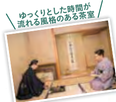
ゆっくりとした時間が 流れる風格のある茶室