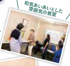
和気あいあいとした 雰囲気のある教室