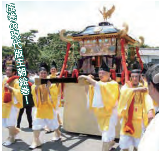
匠巻の現代版王朝絵巻!

ひ見てほしいのは皇居前。二重橋や坂下門といった昔ながらの建築を背景に、まるで江戸時代に迷い込んだかのような景色に出会えます。巡幸範囲は広いので、位置情報のアプリを活用して余すことなく楽しみましょう!