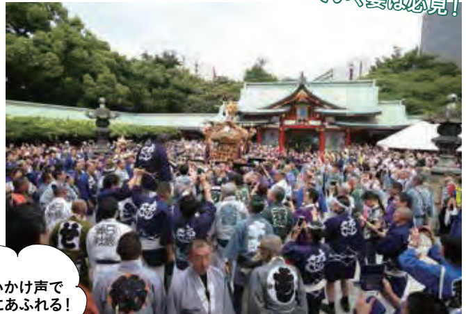
力強いかけ声で熱気にあふれる!