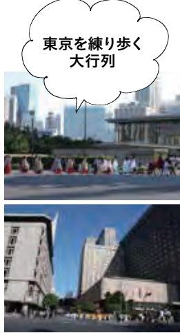
東京を練り歩く大行列